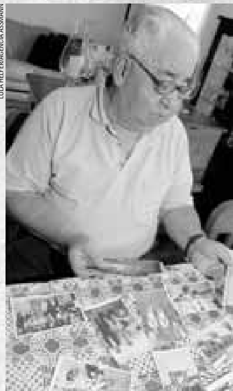
Cardoso e as recordações da época...