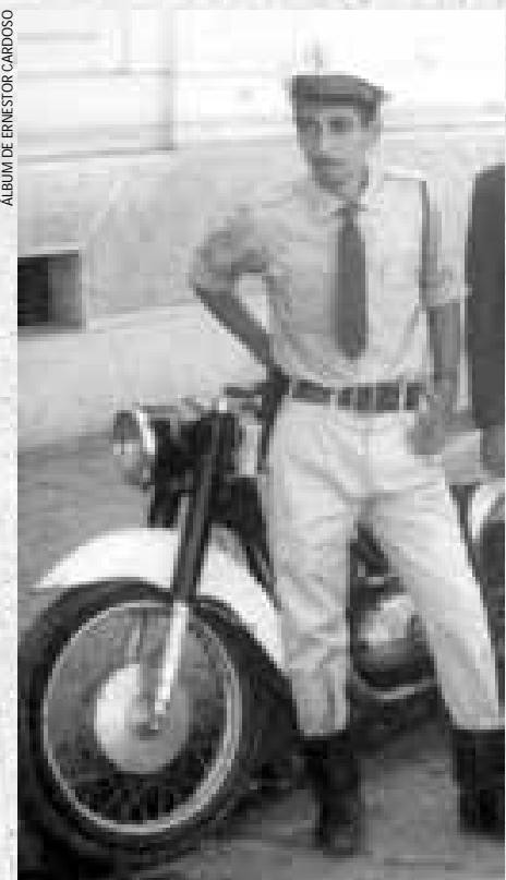
...incluindo retrato com a farda de policial